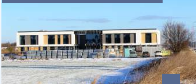
Nowe firmy powstające na Berzynie, obręb Komorowo

Tereny te należą do Gminy Wolsztyn, a także są własnością Krajowego Ośrodka Wsparcia Rolnictwa, Powiatu Wolsztyńskiego oraz osób prywatnych.