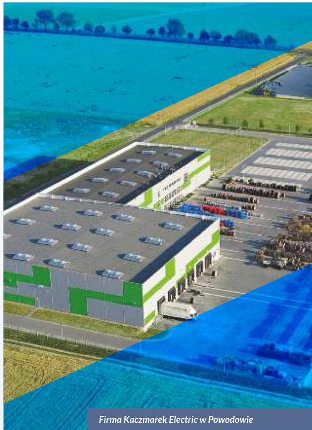
Firma Kaczmarek Electric w Powodowie

Atrakcyjność inwestycyjną Gminy Wolsztyn potwierdza między innymi fakt, iż zainwestowało tu wiele firm, w tym także z udziałem kapitału zagranicznego. Na terenie gminy prężnie działają przedsiębiorstwa usługowe branży budowlanej realizujące również inwestycje wielkokubaturowe i wielkoprzemysłowe.