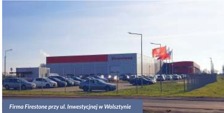
Firma Firestone przy ul. Inwestycyjnej w Wolsztynie

Z roku na rok wzrasta liczba zakładów przemysłowych działających w Gminie Wolsztyn. Poza tym te już istniejące są rozbudowywane. Od roku 2015 powstały tu budynki związane z prowadzeniem działalności gospodarczej o łącznej powierzchni 75.000 m 2 .