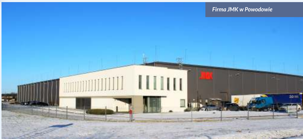
Firma JMK w Powodowie